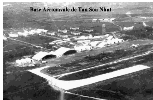
Base Aéronavale de Tan Son Nhut